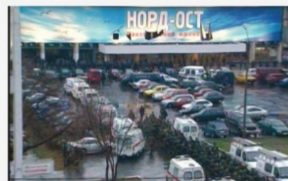
Москва, Дубровка, 25 октября 2002 г.