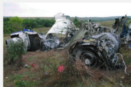
Ростовская область, 24 августа 2004 г. Теракт на борту Ту-154 – место падения

Российская Федерация активно поддерживает усилия мирового сообщества по борьбе с международным терроризмом