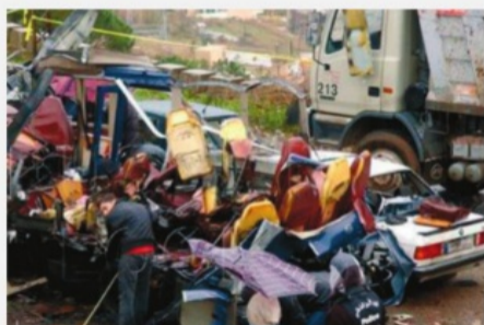
Айн-Аля, Ливан, 13 февраля 2007 г. Взрыв в христианском квартале

Лишенные поддержки иностранных государств и их спецслужб, террористы не смогут продолжать свою деятельность в прежнем объеме.