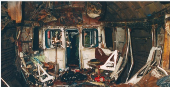
Москва, метро «Автозаводская», 6 февраля 2004 г.

Примеры: «Аль-Каида», движение «Талибан» (Афганистан), «Братья-мусульмане» (Египет), «Абу-Сайяф» (Филиппины), «Ансар аль-Ислам» (Ирак), «Асбат аль-Ансар», «Хизб ут-Тахрир аль-Ислами» (Ливан), «Аум Синрикё» (Япония) и другие.