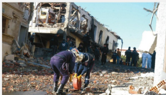
Тения, Алжир, 29 января 2008 г.

Осуществляется организациями этносепаратистской направленности с целью ликвидации экономического и политического диктата инонациональных государств (например, «Ирландская республиканская армия» (Северная Ирландия), «Рабочая партия Курдистана» (Турция), «Батасуна», «ЭТА» (Испания), «Фронт национального освобождения Корсики» (Франция), «Фронт освобождения Квебека» (Канада), «Вооруженные силы национального освобождения» (Пуэрто-Рико, США), «Тигры освобождения Тамил Илама» (Шри-Ланка), «УНИТА» (Ангола) и др.).