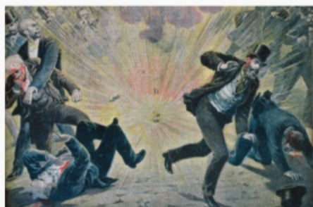
Анише, Франция. 1895 г. Терракт анархиста

В XXI в. просматривается тенденция к расширению масштабов и географии террористической деятельности. Увеличивается число террористических актов, совершаемых с целью личного обогащения. Растет число террористических актов на почве политического противоборства различных сил, а также на почве межэтнических и межконфессиональных противоречий.