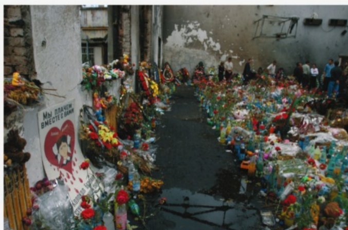
Беслан, сентябрь 2004 г.