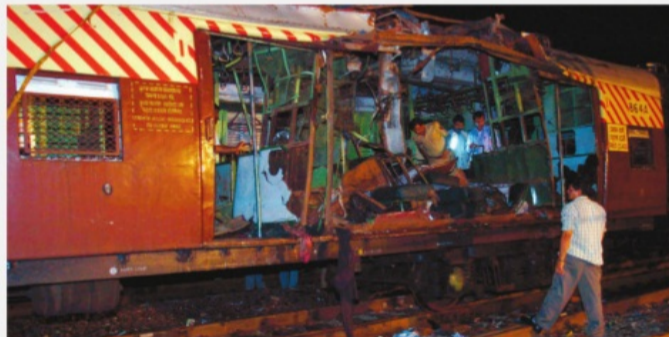
Мумбаи, Индия, 11 июля 2006 г.

Политическая организация, взявшая на вооружение террористические методы борьбы, со временем перерождается в преступную группировку, прикрывающуюся политическими лозунгами.