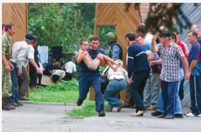
Беслан, сентябрь 2004 г.

Никто, к сожалению, не защищен от ситуации, когда может оказаться в заложниках у террористов