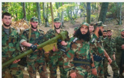
Чеченская Республика, 9 июня 2002 г. Представитель «Аль-Каиды» Абу аль-Валид – уничтожен