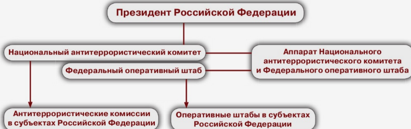
Схема координации противодействия терроризму в Российской Федерации

Важнейшим инструментом антитеррористической политики является осведомленность, то есть знание и готовность к действиям в чрезвычайной ситуации