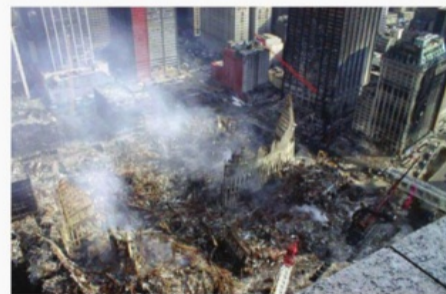
Нью-Йорк, США, 11 сентября 2001 г.

Терроризм по своим масштабам, непредсказуемости и последствиям превратился в одну из наиболее опасных общественно-политических и моральных проблем, с которыми человечество вошло в XXI столетие