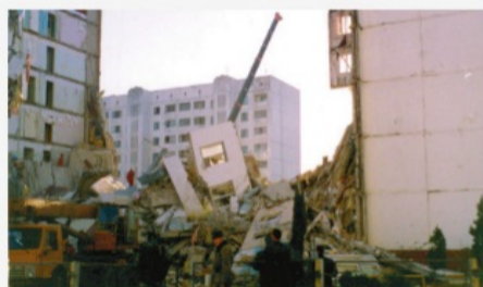
Каспийск, 16 ноября 1996 г.