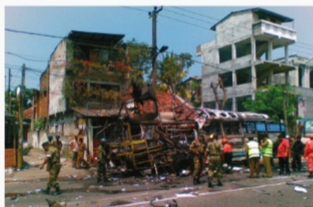
Коломбо, Шри-Ланка, 23 февраля 2008 г.