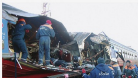
Ессентуки, 5 декабря 2003 г.