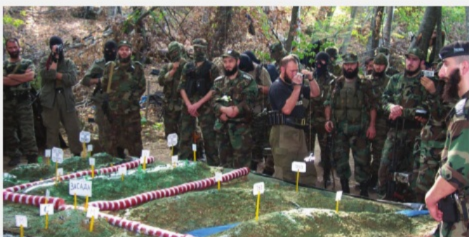
Чеченская Республика, 6 сентября 2002 г.

Субъектами политического терроризма, как правило, выступают радикальные политические партии, отдельные группировки внутри партий или общественных объединений, экстремистские организации, отрицающие легальные формы политической борьбы и делающие ставку на силовое давление (например, «Красные бригады» (Италия), «Фракция красной армии» (Германия), «Аксон директ» (Франция), «Японская красная армия» (Япония), «эскадроны смерти» в Латинской Америке и др.).